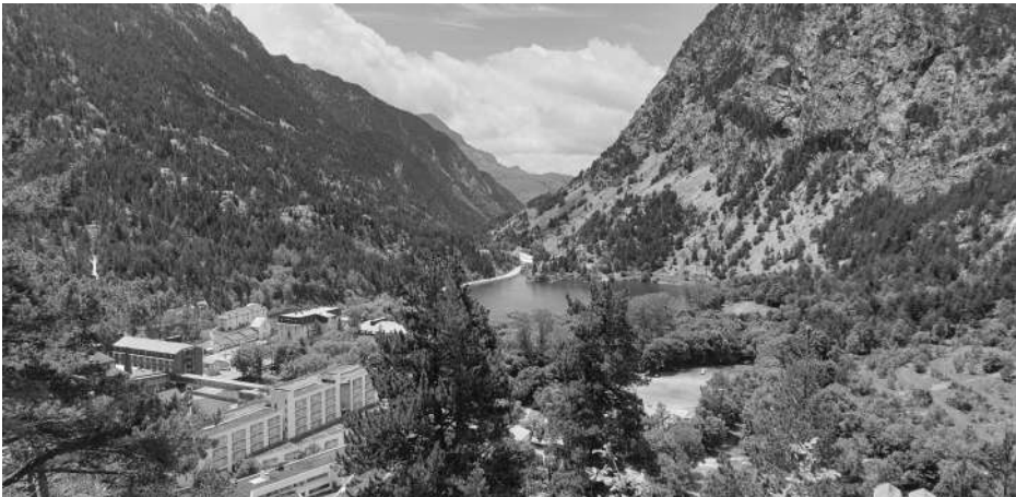
Balneario de Panticosa

El comienzo del turismo en Europa y también en España fue en los balnearios termales, a donde iban familias de las grandes fortunas y también de la alta nobleza, pues así con su gran poder adquisitivo tenían dos prestaciones: recuperar la salud y la ampliación de las relaciones sociales.