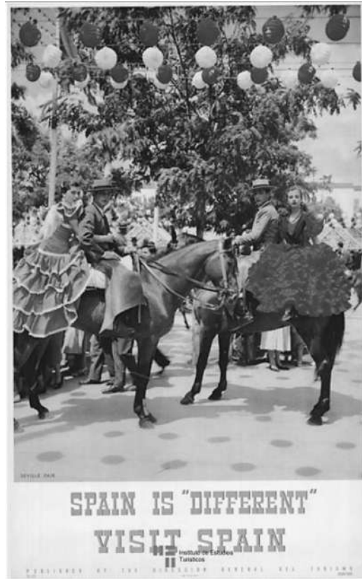
Cartel turístico de Spain is different

Por entonces se ofrecía un turismo barato de sol y playa, paella y sangría, que llegaba en vuelos chárteres de compañías españolas y extranjeras, concentrado principalmente en las costas mediterránea, las islas Baleares y Canarias. Todo eso supuso un enorme urbanismo, construyendo grandes establecimientos hoteleros, desfigurando muchos de los bellos lugares costeros. Los viajeros procedían principalmente de los países europeos de Gran Bretaña, Alemania y Francia, que siguen siendo al día de hoy los principales emisores de turistas.