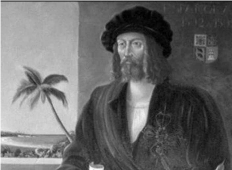
Nicolás de Ovando

Alcántara, una villa que vio nacer a Nicolás de Ovando, el comendador que sustituyó, por orden de Isabel la Católica, a Cristóbal Colón en el Nuevo Continente y fue jefe de destacados extremeños que forman parte de la historia universal como son Francisco Pizarro o Hernán Cortés. También en esta villa vivió con toda su familia Antono de Nebrija, que parte de su gramática castellana fue escrita en este pueblo y al morir en 1522 Nebrija en Alcalá de Henares, al año siguiente, en 1523, nació otro gramático, Francisco Sánchez de las Brozas, El Brocense, cuyas teorías