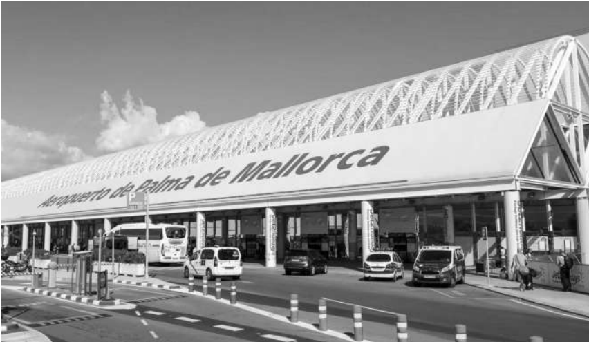
Aeropuerto de Mallorca

La actividad periodístico - turística en el aeropuerto mallorquín incidió más en esta faceta de la promoción de los destinos turísticos a través de los medios informativos, no en balde fue una lanzadera profesional, pues por aquellos años compaginé mi actividad con ser jefe de prensa de la compañía aérea “Hispania” la única compañía aérea cooperativa de Europa, y la corresponsalía en las islas Baleares de la prestigiosa revista nacional “Cambio 16”.