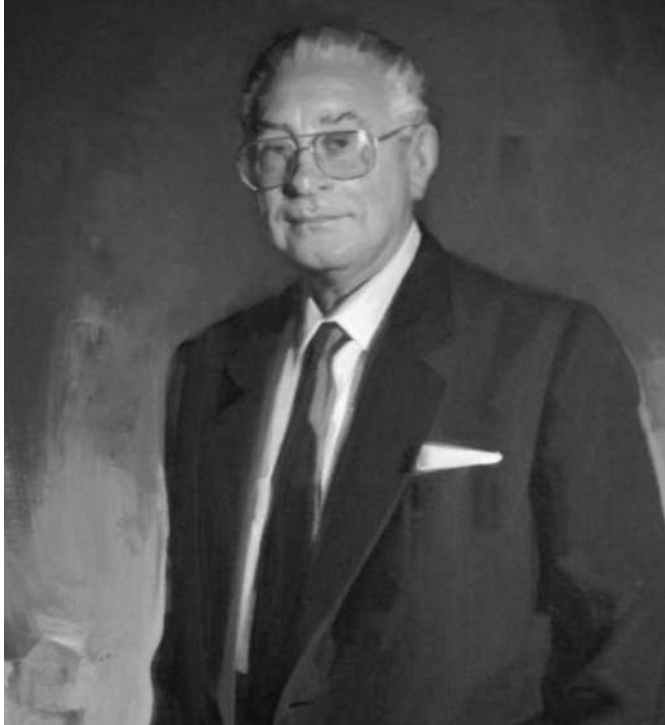
Manuel Alvar, director de la RAE

para la Corona española, en tiempos tan difíciles como los siglos pasados, el mundo es muy interesante y dan ganas de conocerlo. Por eso iba mucho al cine para ver más allá del horizonte lejano de la cercana Raya portuguesa. De esta manera puedo decir que he visitado unos 50 países, bajo el prisma de la profesionalidad del periodista de turismo.