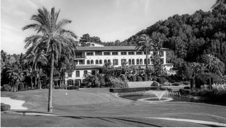
Hotel Castillo de Son Vida