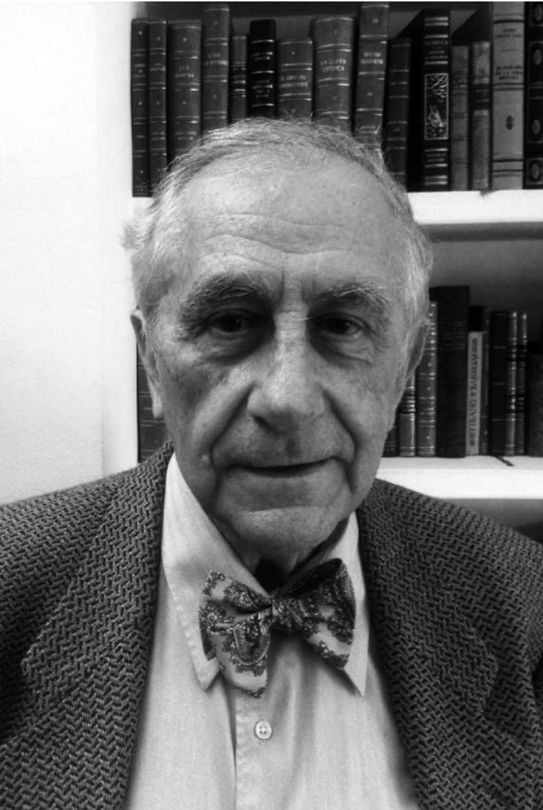
Inocencio Arias es uno de los diplomáticos españoles más reconocidos de los últimos 50 años.

R. Di Stéfano fue un Beethoven, Mozart y Wagner juntos. Probablemente el jugador de fútbol más completo de la historia. Podría haber jugado de portero si hubiera querido y lo hubiera hecho muy bien. Era rápido, inteligente y con un pundonor excepcional. Di Stéfano odiaba perder y lograba galvanizar a sus compañeros. En los 530 partidos que jugó con el Madrid logró notables y sobresalientes en la mayor parte de ellos. Otros jugadores como Maradona sí que consiguieron matrículas, pero también suspensos y no consiguieron galvanizar a sus compañeros.