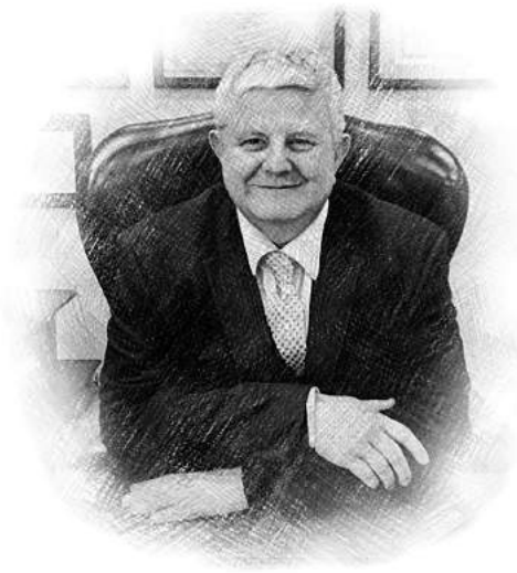
José Ramón Calvo Presidente del Instituto de Cooperación Internacional de la RAED